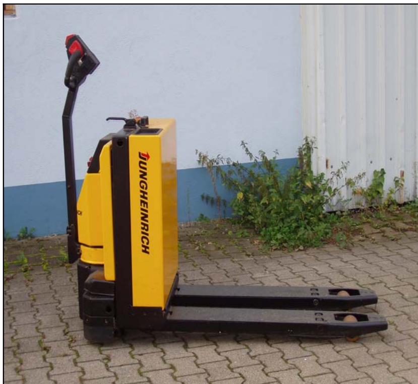
Elektro Deichselstapler 1500 kg