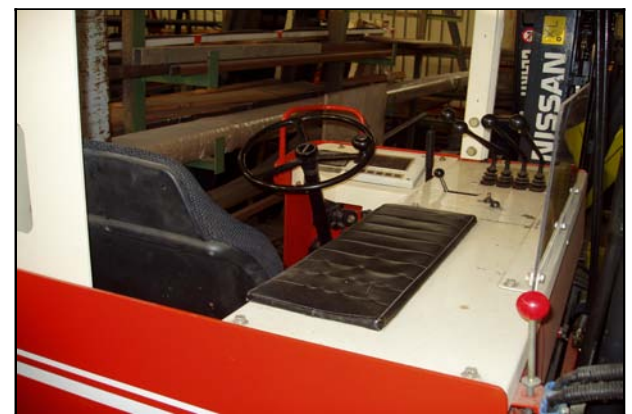
Fahrerplatz von hinten