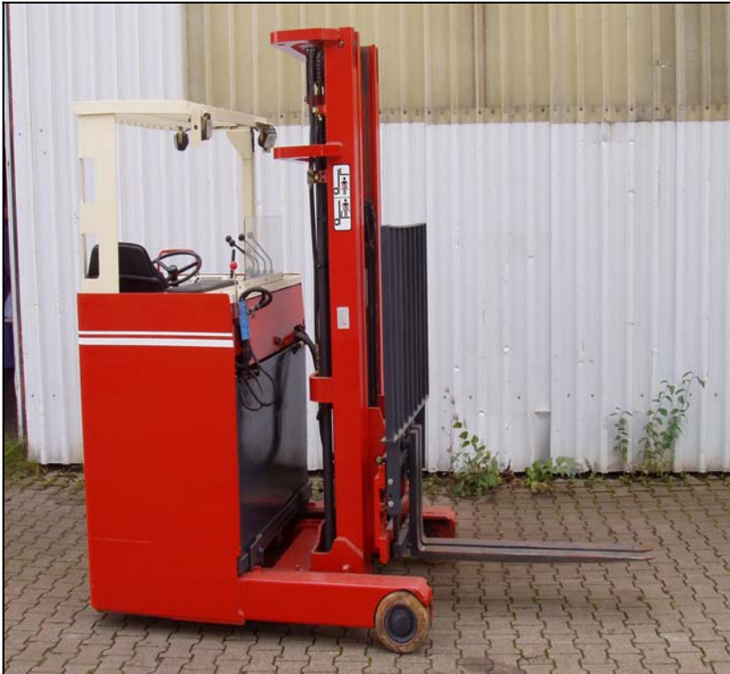
Elektro-Schubmaststapler 1,5 to / 5500 mm Hub