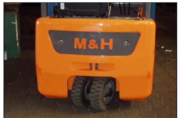
Doppelrad für LKW Befahrung, super wendig

Preiswerte Neu.-und Gebrauchstapler aller Fabrikate Hier M+H Elektro-3-Rad-Stapler mit Doppelrad