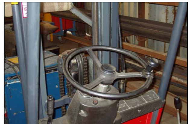
Super heißes Lenkrad